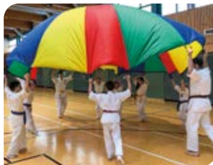
Sichtlich Spaß haben die Kinder und Jugendlichen mit dem neuen Schwungtuch.

In der letzten Winterferienwoche durchliefen die 11 bis 15 Mädchen und Jungen des Karate-Wettkampfteams drei intensive Trainingstage. Von 8.00 bis 13.00 Uhr standen Konditions- und Taktiktraining, Partneranalyse sowie Grundlagen einer Erwärmung auf dem Trainingsplan von Wettkampfrainerin Sensei Ulrike Winkler und Cheftrainer Shihan Michael Schramm. Diese intensive Vorbereitung ist eine gute Ausgangsposition für die Meisterschaft am 22.02.20 in Schweinfurt und am 29.02.2020 in Prag.