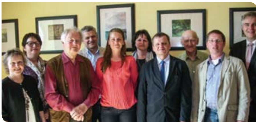
2015 Wurzen: Büro des OBM, Delegation aus Milicz mit Landrat Jan Krzyszofik, Mitgliedern der Heimatkreisgemeinschaft sowie MitarbeiterInnen des Landratsamtes Milicz und der Stadtverwaltung Wurzen

Die Idee einer Städtepartnerschaft mit Milicz geht auch auf eine Initiative der Heimatkreisgemeinschaft Militsch-Trachenberg zurück. Seit Unterzeichnung des Städtepartnerschaftsvertrages zwischen dem Kreis Milicz und der Stadt Wurzen im September 2014 hat jetzt die