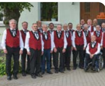
Singen tut Körper und Seele gut Männerchor Nemt ➤ Seite 15