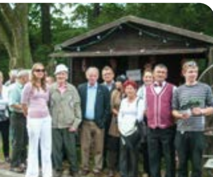
Das Militärische Heimattreffen findet wieder statt ➤ Seite 08