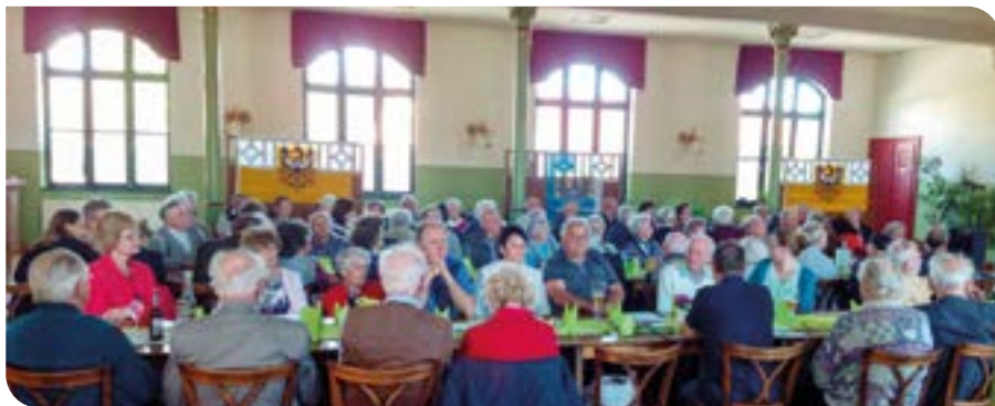
2018 Thallwitz Militscher Heimattreffen

Nach dem Fall der Mauer 1989 gab es auch für die ostdeutschen Schlesier die Möglichkeit offen über ihr Herkommen und ihre Heimat zu sprechen und Zusammenkünfte zu organisieren. Schließlich kam der überwiegende Teil der ehemaligen deutschen Bevölkerung aus dem Kreis Militsch nach Flucht und Vertreibung 1945 in den damaligen Kreisgebieten Borna, Grimma und Wurzen an und fand hier eine neue Bleibe. Es ist vielleicht Zufall, dass sich diese Verwaltungseinheiten zum heutigen Kreisgebiet zusammengeschlossen haben und schon vorher zur neuen Heimat eines Großteils der ehemaligen deut-