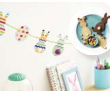
Tipps: Osterbasteln mit Kids und Osterhasen-Kekse ➤ Seite 22