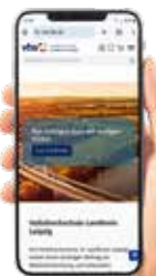
Volkshochschule Landkreis Leipzig

Abgerundet wird das Angebot durch Informations- und Diskussionsveranstaltungen zu aktuellen gesellschaftlichen Themen. Einen vollständigen Überblick über alle Angebote des Frühjahrs 2024 bietet der übersichtliche Kursfinder auf der brandneuen Internetseite der Volkshochschule: www.vhs-ikl.de .