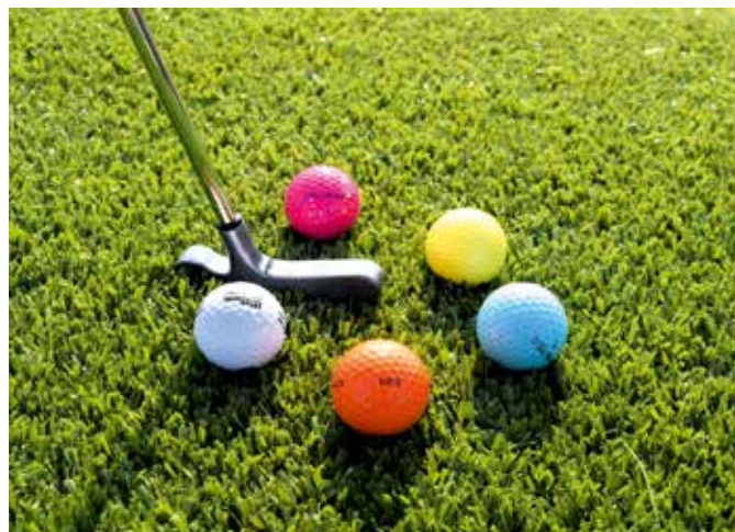
Spielspaß für die ganze Familie: Ab Ostern kann am Markkleeberger See wieder gegolft werden.