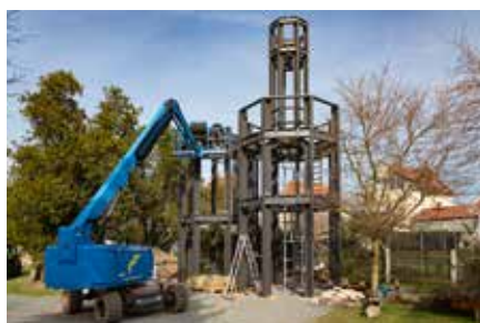
Verein Neues von der AG Fahrradkirche Zöbiger