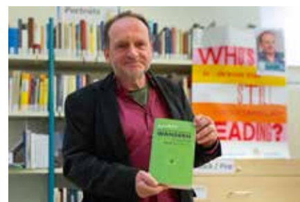
Markkleeberg aktuell Leipzig liest, Markkleeberg auch