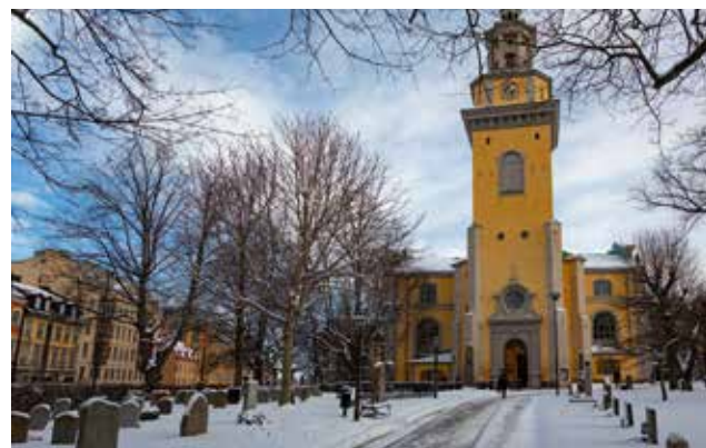
Friedhöfe der Welt (14): Maria Magdalena kyrkogård, Stockholm, Schweden