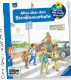
Cover: Ravensburger Verlag

Am 1. Juli erschien das Kindersachbuch „Wieso? Weshalb? Warum? Alles über den Straßenverkehr“, das im Rahmen einer Kooperation zwischen Deutscher Verkehrswacht (DVW) und dem Verlag Ravensburger entstanden ist. Das Buch greift anschaulich die Herausforderungen des mobilen Alltags von Kindern ab vier Jahren auf und vermittelt dabei spielerisch wichtige Verhaltensregeln, um sich sicher im Straßenverkehr zu bewegen. Gemeinsam mit den Eltern oder anderen Erwachsenen können verschiedene Verkehrssituationen sowie mögliche Gefahren und ihre Vermeidung besprochen werden. Mit detailreichen Bildern, informativen Texten und Klappen erfahren Kinder zum Beispiel etwas über das richtige Verhalten auf dem Gehweg, die sichere Straßenüberquerung, Fahren mit Bus und Bahn oder was zu beachten ist, wenn sie mit dem