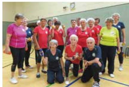
Verein SV Gaschwitz 09 e.V.