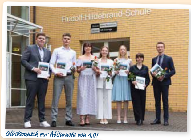
Glückwunsch zur Abiturnote von 1,0!