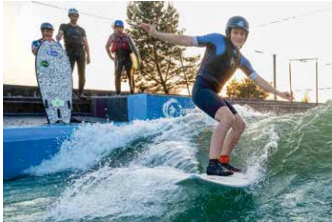
Vom Anfänger zum Wellenreiter: Der Tages-Surfkurs vermittelt schnell ein sicheres Gefühl auf dem Brett.