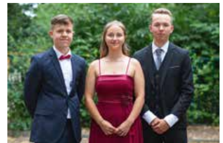
Absolventen 2022 Schulabgänger an OSM und RHS