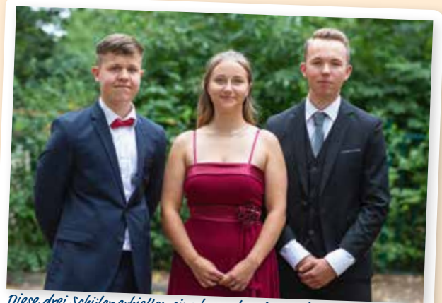
Diese drei Schüler erhielten eine besondere Auszeichnung.