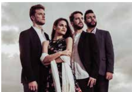
Die Gruppe Cantoria aus Spanien.

Das Internationale Festival für Vokalmusik „a cappella“ Leipzig wird in diesem Jahr digital umgesetzt und live im Stream gezeigt. An den ersten beiden Mai-Wochenenden 2021 gibt es acht Konzerte sowie einen Live-Chat. Dabei übertragen das schwedische Ensemble Ringmasters und die Gruppe Cantoria aus Spanien ihre Auftritte live aus ihren Heimatländern.