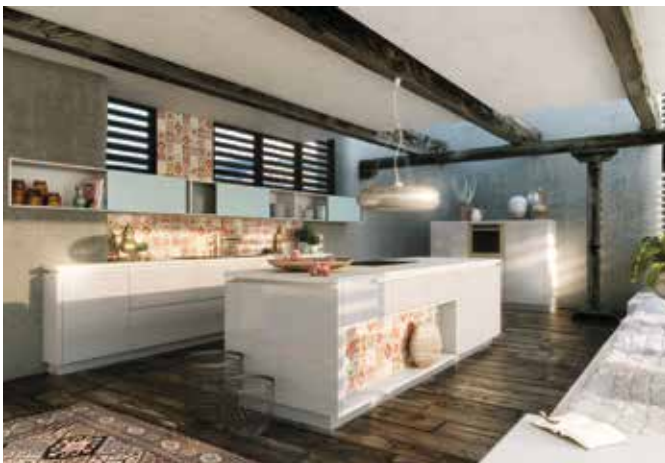
Orientalische Tradition trifft abendländische Moderne.