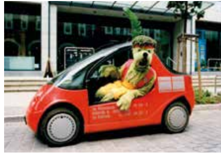
1997: Emil-Grünbär-Aktion im „Hotzenblitz“ vor dem Küchenstudio in Löhrs Carré.