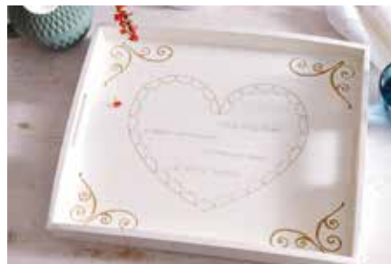
Muttertag-Spezial Originelle Geschenkidee zum Muttertag