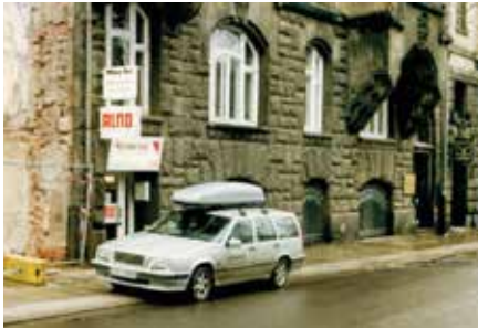
Das erste Geschäft Anfang der 1990er-Jahre am Dittrichring in Leipzig.