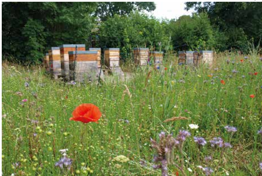
Die Blühwiese mit den Bienenstöcken der Bioimkerei Laubinger.

■ Mehr Informationen unter: www.kgv-zur-sonne.de www.fairbund-kleingarten.de