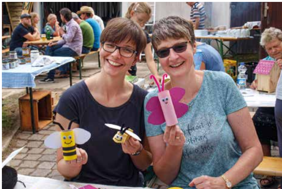
Auf Bienen bezogenes Basteln beim Imkerfest 2018.

„Vorgesehen ist, dass ab Mitte des Jahres mit der Sanierung unserer Elektroanlage begonnen werden kann, dieses Vorhaben wird längere Zeit in Anspruch nehmen. Vieles werden wir in Eigenregie erledigen, unter anderem die erforderlichen Erdarbeiten. Dann kann die Verlegung der Elektro-