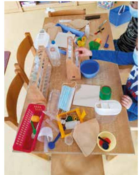
An der „Impfstation“ erfahren die kleinen Entdecker mehr über die Pandemie.

Es gab auch schon die ersten Freiwilligen, die tapfer eine Impfung wahrgenommen haben. Natürlich können sich alle Interessierten der Kita einen Termin holen – und zwar ohne vorher digitale Hürden über-