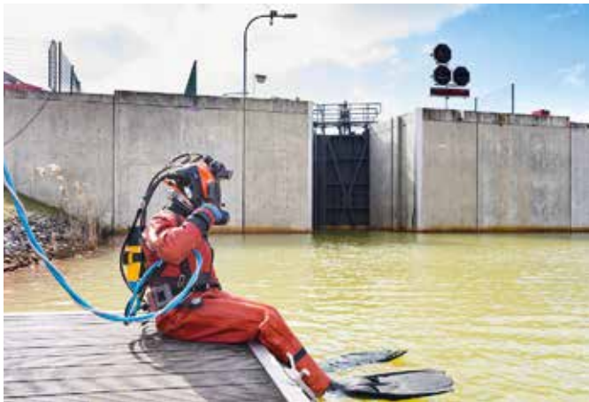
Tauchinspektion an der Schleuse.