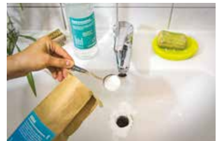
Bauen/Wohnen/Einrichten Frühjahrsputz trifft Umweltschutz