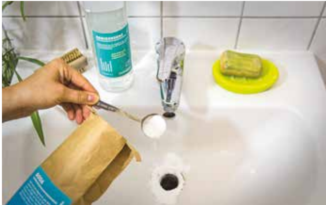
Müffelnde Abflüsse kann man mit Soda und Essig reinigen.

Nachhaltig sauber: Wie der Haushalt auch mit Hausmitteln blitzblank wird