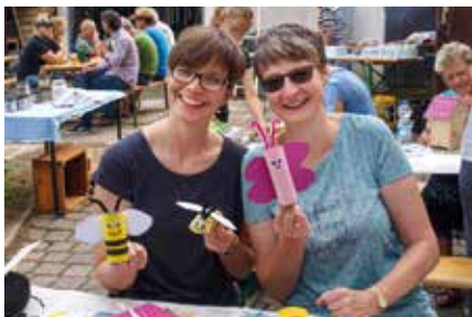
Verein Kleingärtnerverein „Zur Sonne“ e.V.