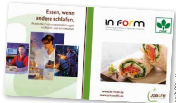
Grafik: DGE e. V.