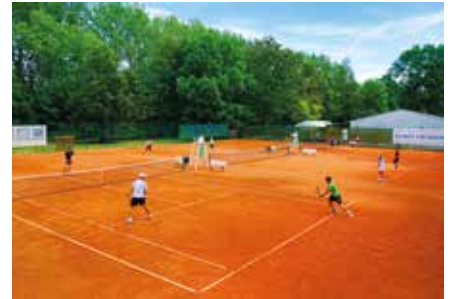
Beim Pfingstturnier 2019 (ebenso unteres Foto).

Während die Spieler die ersten sportlichen Akzente der jungen Vereinsgeschichte setzten, begann das zähe Ringen um die Baugenehmigung – trotz der abgesehenen Lage abseits der Wohnimmobilien musste nach Bürgereingaben sogar ein Schallgutachten erstellt werden. „Im Jahr 2000 war es endlich soweit, die Stadt erteilte die nötige Baugenehmigung. Ausgestattet mit Baufreiheit und einem Privatkredit über 30.000 DM, den uns sechs euphorische Mitglieder gewährten, startete der fördermittelfreie Bau unserer Anlage weitestgehend in Eigenregie und in vielen Stunden ehrenamtlicher Arbeit. Und dank eiserner Sparmaßnahmen war auch der Mitgliederkredit schon bald getilgt.“ Etwas mehr als fünf Jahre nach der Vereinsgründung, im Mai 2001, erfüllt sich der lang gehegte Traum nun endlich: Mit einem großen Turnier eröffneten wir unsere Plätze feierlich.