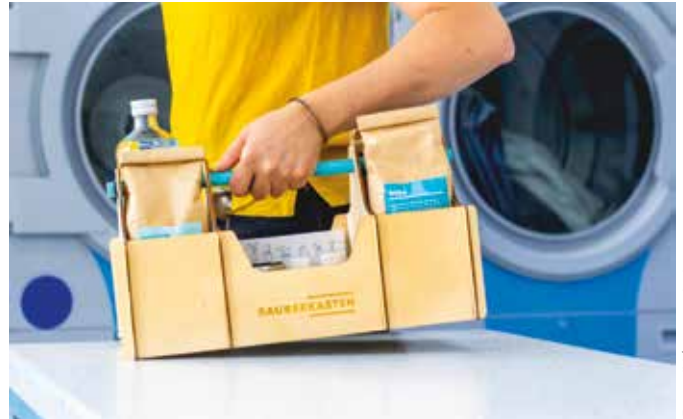
Im Kasten ist alles, was man zur Reinigungsmittelherstellung braucht.

Die Frühlingssonne bringt es oft schonungslos ans Licht: Staub auf den Regalen, hartnäckige Kalkreste in Wanne und Waschbecken, ein Schmierfilm auf den Küchenoberflächen und dazu Fenster, die von Regentropfen, Kerzenruß und anderen Rückständen trübe sind. Höchste Zeit für den berühmten Frühjahrsputz! Doch was tun, wenn der Wunsch nach Reinlichkeit mit dem steigenden Bewusstsein für Nachhaltigkeit kollidiert? Denn die große Zahl an herkömmlichen Haushaltsreinigern enthält häufig schädliche Stoffe wie Säuren, Bleiche, Phosphate, Formaldehyd oder Natriumsulfat. Das belastet Natur und Gewässer, außerdem kann es der Gesundheit zusetzen und Allergien auslösen.