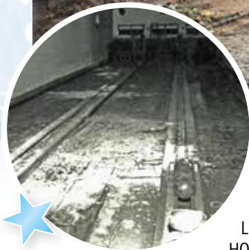
So präsentierte sich die alte Kegelbahn Ende der 1980er-Jahre. 1989 begann der Umbau...