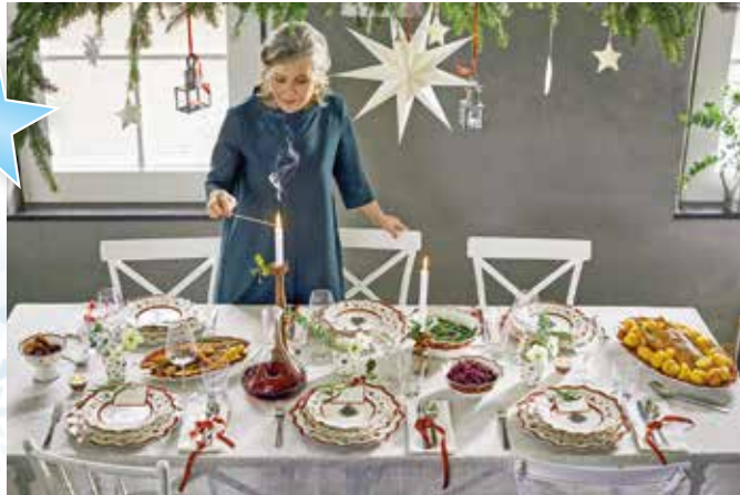
Es ist angerichtet: In einem solchen Ambiente freuen sich nicht nur die Kleinen auf den Besuch des Christkinds.

Ein stimmungsvoll gedeckter Tisch als Glanzpunkt der schönsten Zeit des Jahres