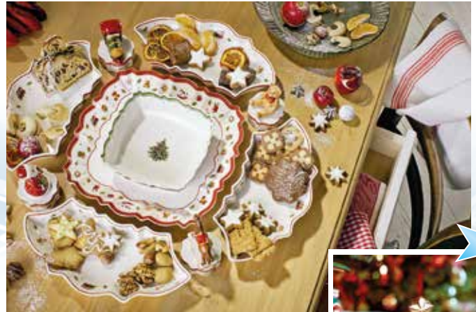
Highlight ist das Vorspeisen-Set, das nach persönlichen Wünschen arrangiert werden kann.

Mit dem Entzünden der Adventskerzen ist sie da: die Weihnachtszeit – und mit ihr kindliche Vorfreude, das Erinnern an vergangene Feste und das Beisammensein mit Familie und Freunden. Jetzt zieht Besinnlichkeit ein und Haus und Wohnung werden aufwendig dekoriert. Ein Glanzpunkt in den eigenen vier Wänden ist natürlich der feierlich gedeckte und mit viel Liebe zum Detail geschmückte Esstisch. Schließlich kommen hier die Lieben zusammen, um gemeinsam Stollen und Plätzchen sowie den herzhaften Braten zu genießen.