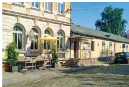
Jubiläum 30 Jahre Bowling-Bar