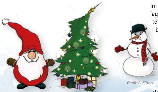
Grafik: A. Bittner

Spannende Momente rund ums Rennen nach Geschenken