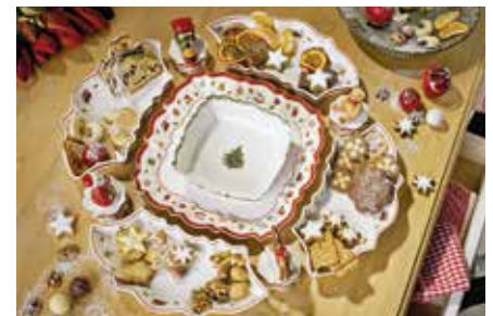
Bauen/Wohnen/Einrichten Ein stimmungsvoll gedeckter Tisch