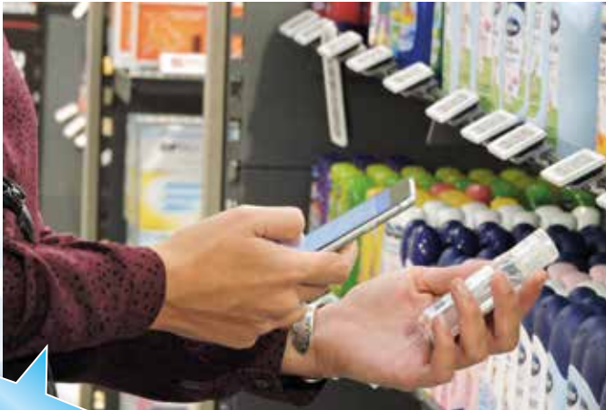
Allergiker können mit Hilfe der App die Produkte wählen, die sie gut vertragen.