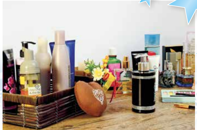
In Cosmile kann man die Inhaltsstoffe der verschiedenen Kosmetikprodukte leicht erkennen.

In der Adventszeit werden verstärkt Produkte in Parfümerien, Drogerien und Kosmetikabteilungen nachgefragt. Doch nicht jedes Produkt passt für jeden. Mit einer App haben Verbraucher einen Einkaufshelfer, der sie genau über ihre Kosmetika informiert. Die App gibt zu jedem Inhaltsstoff die deutsche Bezeichnung an und beschreibt, welchen Zweck diese Substanz in kosmetischen Produkten erfüllt. Für Allergiker besonders interessant: Mit einer Filterfunktion können einzelne Inhaltsstoffe oder ganze Stoffgruppen, auf die ein besonderes Augenmerk gerichtet wird, markiert werden. Damit wird bei jedem weiteren Produktskan auf diese ausgewählten Inhaltsstoffe hingewiesen. So erkennen Allergiker leicht, ob ein bestimmter Stoff, den sie nicht vertragen, enthalten ist und können den Kontakt damit vermeiden. Bei Kosmetikprodukten hilft die Verbraucher-App mit Namen Cosmile, solche Inhaltsstoffe schnell zu erkennen und liefert Informationen zu den Inhaltsstoffen, welche die Kosmetikerhersteller in Körperpflegeprodukten wie zum Beispiel Creme, Shampoo oder Zahncreme verwenden und die auf den Produkten ausgewiesen werden.