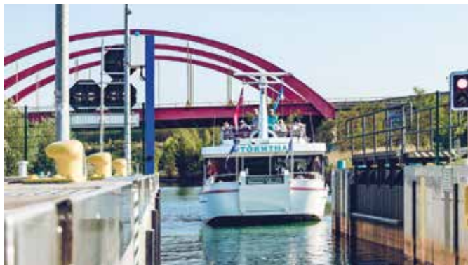
Die Kanupark-Schleuse verbindet den Markkleeberger und Störnthaler See und hat jetzt wieder regulär geöffnet.