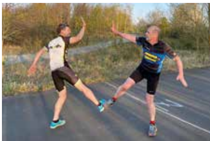
Verein TRISars Markkleeberg e.V.