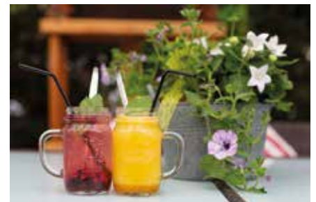
Tipps Restaurant City mit neuer „Gartenlaube“