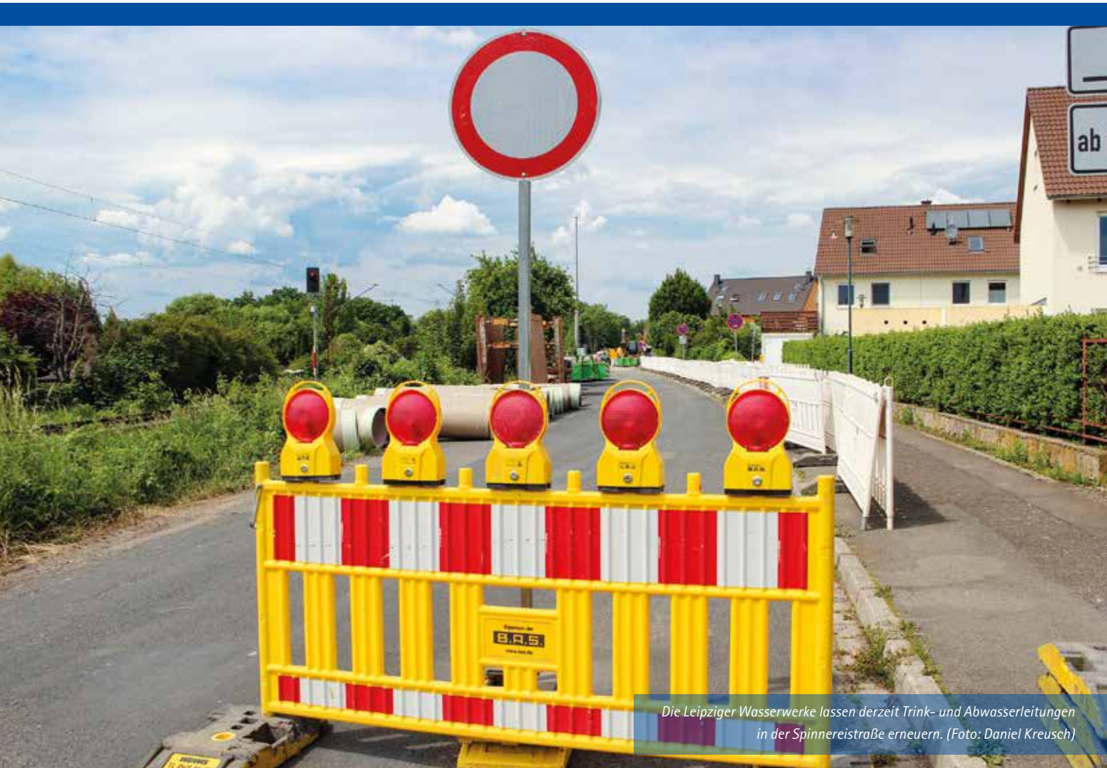
Die Leipziger Wasserwerke lassen derzeit Trink- und Abwasserleitungen in der Spinnereistraße erneuern.

Amts- und Mitteilungsblatt der Großen Kreisstadt Markkleeberg