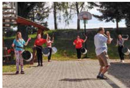
Markkleeberg aktuell Stadtfanfarezug im Probenlager