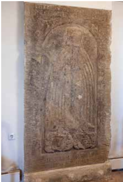
Epitaph der Catarina von Crostewitz in der Auenkirche.

An der Nordwand des Kircheninneren befindet sich ein Epitaph der Catarina von Crostewitz (Sandstein 1,20 x 2,00 Meter) in betender Stellung mit dem Wappen derer von Crostewitz von 1560. Die Umschrift lautet: „ANNO DOMI. 1560 AM SONABENT NACH OCV / LI IST IN GOT ENTSCHLAFEN VND GOTSSELIGLICHEN VORSCHIEDEN / DIE EDELE VND VILTVGENDSAME FRAW / CATARINA OTTO VON CROSTEWITZ ZV ...LITZ ...EHLICH GEMAHL EINE GEBORNE VON WEISENBACH / HER HANSEN DES HEILIGEN ROMISCHEN REICHES ERBRITTER / DOCHTER AVF KRIMYSCHTZAV / DER GOT GENEDIG AMEN.“