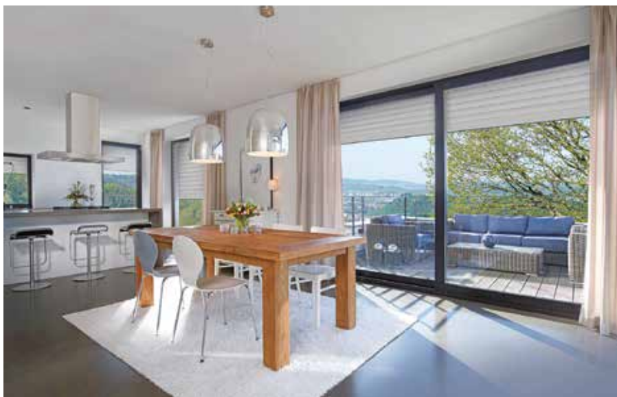
Räume mit großen Fensterfronten können durch Sonneneinstrahlung überhitzen. Verhindern lässt sich das durch automatisierte Sonnenschutzsysteme.

Im Frühling und Sommer genießt man die Sonnenwärme auf der heimischen Terrasse oder dem Balkon. In den eigenen vier Wänden kann die Sonneneinstrahlung aber zu viel des Guten werden. Besonders in Häusern mit großen Fensterflächen können sich die Wohnräume unangenehm aufheizen. Reine Fensterlüftung bringt in längeren Wärmeperioden kaum Besserung. „Statt die Räume mit Ventilatoren oder Klimageräten zu temperieren, ist es ratsam, sie gar nicht erst zu warm werden zu lassen“, rät Peggy Losen, Marketingleiterin bei Rademacher. Automatisierte Rollladensteuerungen beschatten die Räume selbstständig, wenn es nötig ist, und sorgen so ohne zusätzlichen Energieaufwand für ein angenehmes Raumklima. Smarte Systeme können neben Rollläden auch Raffstores, Jalousien oder Markisen steuern und damit Sonnenschutz nach Maß bieten.