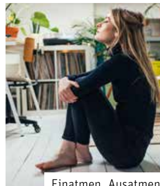
Einatmen. Ausatmen. Wichtig für Menschen – auch für Wände?