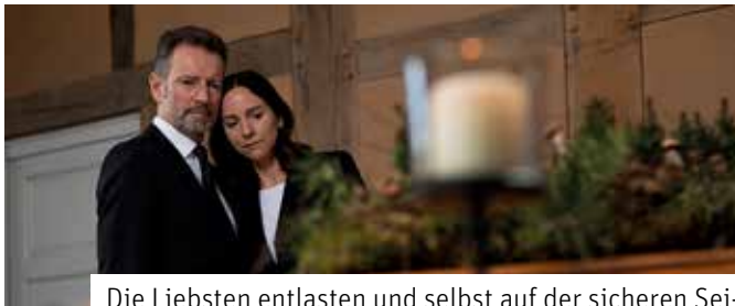
Die Liebsten entlasten und selbst auf der sicheren Seite sein mit einem Bestattungsvorsorgevertrag.

des Bestattungsvorsorgevertrages ausgezahlt. Auch möglich ist eine Sterbegeldversicherung – etwa über das Kuratorium Deutsche Bestattungskultur und seine Partner. Vor allem wer unter 70 ist, wird möglicherweise diese Lösung attraktiv finden. Hier werden monatlich kleine Beträge in eine Sterbegeldversicherung eingezahlt, die im Todesfall ausbezahlt wird. Gerade für Menschen mit kleineren Einkommen ist dies interessant. Weitere Infos unter www.bestatter.de/bestattungsvorsorge .