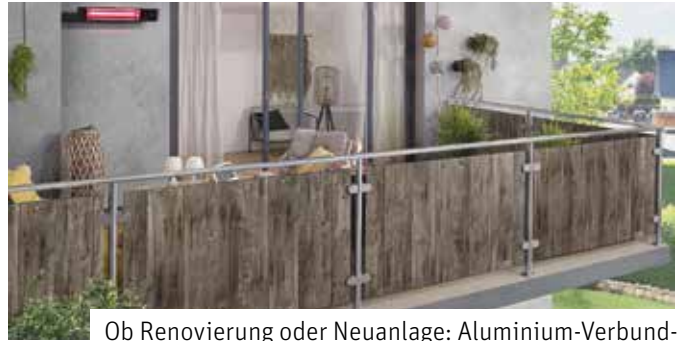
Ob Renovierung oder Neuanlage: Aluminium-Verbundplatten eignen sich optimal für die moderne Fassaden- und Balkongestaltung.

Durch Witterungseinflüsse kann die Oberfläche von Balkonbrüstungen oder von Sichtschutzwänden beeinträchtigt und beschädigt werden. Eine robuste, abriebfeste und UV-beständige Oberflächenveredelung ermöglicht zugleich eine einfache Reinigung, denn Schmutz kann sich praktisch nicht festsetzen. Aluminium-Verbundplatten beispielsweise sind langlebig, wetterfest und korrosionsfrei, auf diese Weise können sich Frischluftliebhaber viele Jahre an ihren Balkonverkleidungen erfreuen. Sie eignen sich sowohl bei der Sanierung und Renovierung als auch im Neubau. Die Aluverbundplatten zeichnen sich durch ein geringes Eigengewicht bei gleichzeitig hoher Festigkeit und unkomplizierte Montage auf nahezu allen Unterkonstruktionen aus. Besonders an dem Alucom Design-Exterieur Produktportfolio von Wilkes ist unter anderem die sanftmatte Perlstruktur. Die Platten sind in einer Vielzahl verschiedener Dekore erhältlich, etwa in Stein-,