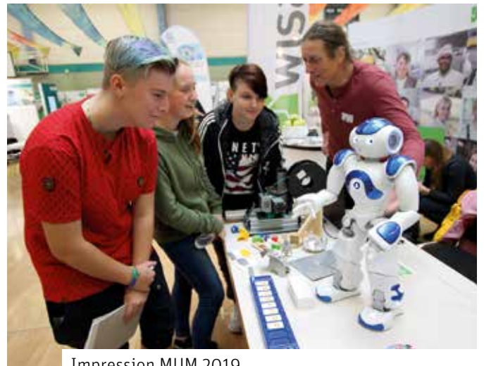
Impression MUM 2019