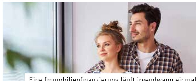
Eine Immobilienfinanzierung läuft irgendwann einmal aus – und muss dann auch nicht mehr durch eine Berufsunfähigkeitsversicherung abgesichert sein.

eine Berufsunfähigkeit, auch deshalb sind die Beiträge für eine Erwerbsunfähigkeitsversicherung günstiger. Wer also etwas Geld auf der hohen Kante hat und bei einer Berufsunfähigkeit bereit wäre, umzuschulen, für den ist diese Police eine interessante Option.