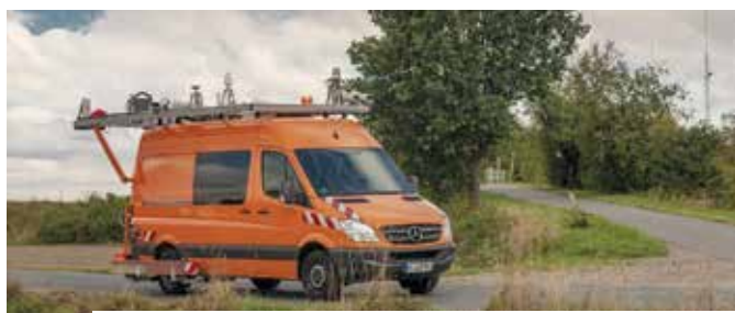
Messfahrzeug für Messung Ebenheit und Substanzmerkmale

Am Fahrzeug befindet sich modernste Technik, u. a. hochauflösende Kameras und verschiedene Laserscanner. Mit dieser Tech-