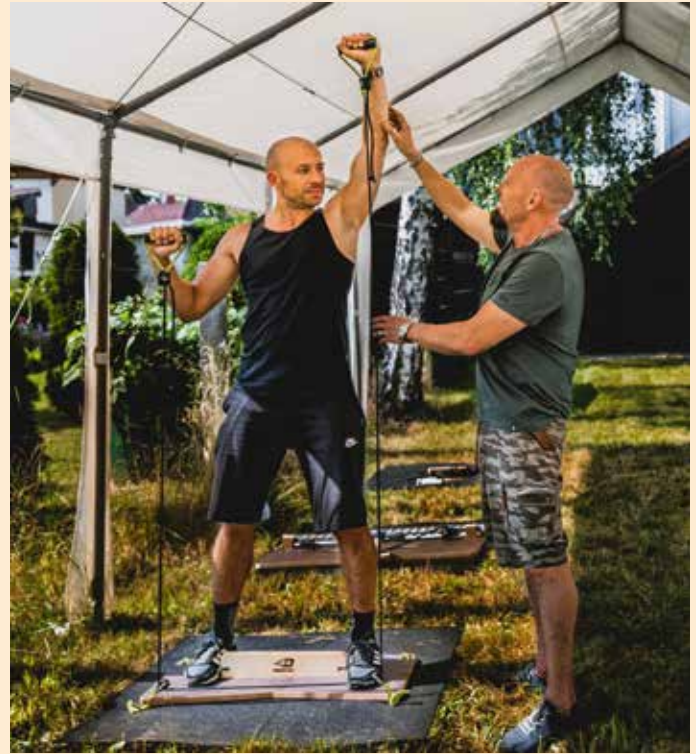
Training im Garten von MED4FIT!

am besten bei einem kostenlosen unverbindlichen Probiertraining nach Terminabsprache. Hier wird sogar eine kurze Analyse nach Wunsch durchgeführt. Kontakt und Infos: www.med4fit.de , Markranstädt, Teichweg 16, Tel.: 034205411311.