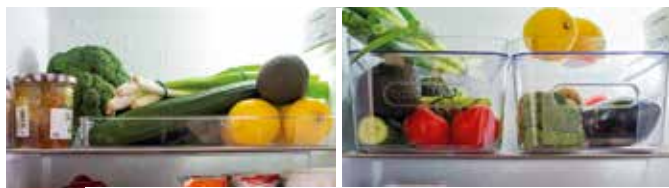
Vorher und Nachher im Vergleich

Lebensmittelverschwendung ist ein echtes Problem: Pro Kopf und Jahr landen in Deutschland etwa 75 Kilogramm Essen im Müll. Unordnung und ein mangelnder Überblick über die Vorräte im Kühlschrank sind mögliche Ursachen dafür, warum Obst, Gemüse, aber auch Milchprodukte, Eier und Aufschnitt verderben, anstatt verwendet zu werden. Um dem entgegenzuwirken und die Nahrungsmittel vor dem Müll zu retten, ist eine „Iss-mich-zuerst“-Box im Kühlschrank ideal: Lebensmittel, die eine kurze Haltbarkeit haben und schnell verzehrt werden müssen, landen darin. Steht die Box gut sichtbar im Kühlschrank, werden die Inhalte sicherlich nicht so leicht übersehen.