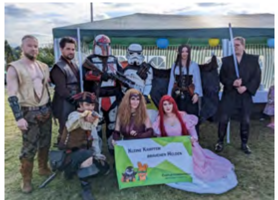
Cosplay Team Sachsen

Viele tolle Aktionen warten am Samstag in der Reichsstraße auf Kinder und Familien. Unter anderem wird unsere Mediothek diverse Outdoor-Spiele präsentieren, die zum Mitmachen und Ausprobieren einladen. Zudem öffnet die Fahrbibliothek ihre Türen, im Kinderkarussell können die Knirpse eine Runde drehen, das Cosplay Team Sachsen ist mit einem Pavillon vertreten, in dem es eine Süßigkeiten-Schleuder, Dosen werfen sowie Kinderschminken geben wird, Augenoptik Seiberlich wartet mit einer Kinderspiel- und Bastecke auf Besucher und der Bienvenue e.V. wird kleine Zirkusaktionen präsentieren.