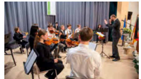
Das Musikschulorchester Wurzeln der Musik- und Kunstschule Landkreis Leipzig spielte beim Neujahrsempfang des Landrates 2023

Und nicht vergessen, am Samstag feiert die Musik- und Kunstschule Landkreis Leipzig ihren Tag der offenen Tür und wird ihre Musikdarbietungen zwischen 16.15 und 19.30 Uhr auf die große Bühne bringen! Los geht es mit dem Nachwuchsorchester „Saitenwind“. Es folgen zwei Bands: Die Musiker von „Jamm'n“ zeichnen sich vor allem durch eine Liebe zum französischen Rock aus und die jungen Talente von „Teilsaniert“ hauchen mit ihrer frischen und dynamischen Art den großen Klassikern der Rockmusik neues Leben ein. Um 17.30 Uhr startet die Jukebox, bei der sich rund 50 Schüler an Schlagzeug, E-Gitarre, Gesang, Bass und Klavier zu einem gemeinsamen Konzert zusammenfinden. Entstanden ist ein abwechslungsreicher Mix der letzten 20 Jahre von Kraftklub über Amy Mc'Donald bis hin zu Namika und Ed Sheeran.