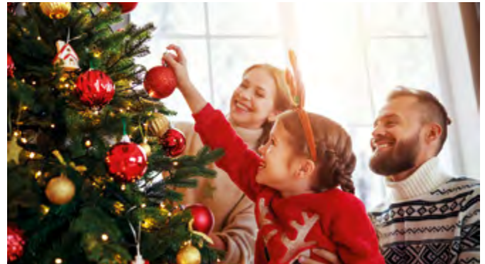
Ein schönes Weihnachtsfest im Kreis der Familie ist den meisten Deutschen besonders wichtig.

In herausfordernden Zeiten, in denen vieles nicht mehr so ist, wie es einmal war, ist es wichtig, nicht den Halt zu verlieren. Dabei können wiederkehrende Rituale helfen. Ein schönes Weihnachtsfest im Kreis der Familie ist den meisten Deutschen besonders wichtig. Mit dem ersten Advent beginnt die Vorweihnachtszeit, eine Zeit der Vorfreude, jedoch auch der Ungeduld. Das Haus wird dekoriert, und die Jüngsten können es oft kaum erwarten, an Heiligabend endlich die Geschenke zu öffnen, die der Weihnachtsmann in die festliche Wohnstube gebracht hat. Hier sorgt vor allem der Kerzenschein des Christbaums für eine heimelige Atmosphäre, in der man es sich mit seinen Liebsten gemütlich macht, um zu naschen, zu singen und gemeinsam Geschenkpapier zu zerreißen.