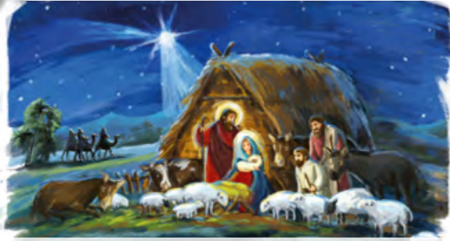
Alle Angaben ohne Gewähr! Änderungen vorbehalten!

Heiligabend | Samstag | 24.12. Borna 15.00 Uhr Andacht mit Krippenspiel 22.00 Uhr Christnacht Hochfest der Geburt des Herrn | Sonntag | 25.12. Borna 10.30 Uhr Heilige Messe Fest des Hl. Erzmärtyrers Stephanus | Montag | 26.12. Deutzen 10.30 Uhr Heilige Messe Fest der Unschuldigen Kinder | Mittwoch | 28.12. Frohburg 9.00 Uhr Familiengottesdienst zur Eröffnung der Sternsingeraktion in der ev. - luth. Stadtkirche St. Michael Donnerstag | 29.12. Borna 18.00 Uhr Stille Anbetung 19.00 Uhr Heilige Messe Fest der Hl. Familie | Freitag | 30.12. Borna 9.00 Uhr Heilige Messe Silvester | Samstag | 31.12. Borna 18.00 Uhr Andacht zum Jahresschluss Hochfest der Gottesmutter Maria | Sonntag | 01.01.2023 Borna 10.30 Uhr Heilige Messe 17.00 Uhr Ökumenischer Gottesdienst in der kath. Kirche St. Joseph Hochfest der Erscheinung des Herrn | Freitag | 06.01.2023 Borna 9.00 Uhr Heilige Messe Zedtlitz 17.00 Uhr Ökumenischer Familiengottesdienst zum Abschluss der Sternsingeraktion in der ev. - luth. Kirche Fest der Taufe des Herrn | Sonntag | 08.01.2023 Borna 10.30 Uhr Heilige Messe