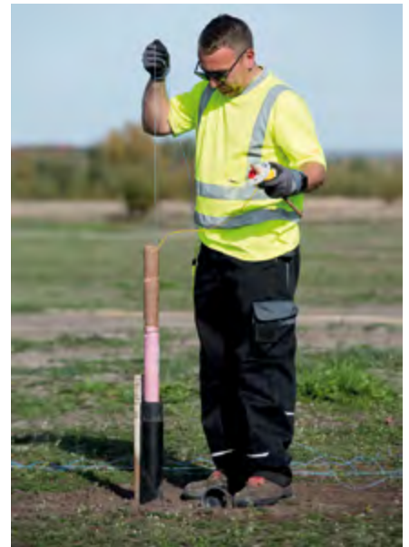
In die Bohrlöcher kommen 4 bis 12 Kilogramm Sprengladung für Dipol- u. Einpolsprengungen.

druckverdichtung (sRDV) auf insgesamt acht Rüttel(Test)feldern. Die Sanierungstechnologie wurde ca. ein anderthalbes Jahr lang erprobt. In den kommenden Jahren wird auch für das Probefeld Ost – östlich des Erosionsgerinnes – die beste Sanierungstechnologie ermittelt werden. Als Nächstes startet Anfang November 2022 die Nacherkundung des Probefeldes West mit Hilfe von Linerbohrungen. Im Anschluss an die Oberflächenprofilierung läuft eine Drucksondierungskampagne. Nach Auswertung aller Ergebnisse kann das Sächsische Oberbergamt die in den jeweiligen Teilbereichen entsprechend angepassten Sanierungstechnologien für die Hauptsanierung genehmigen. Zielstellung aller Sanierungsmaßnahmen am Speicher Borna ist die gefahrlose Nutzung der Flächen und damit die Aufhebung des geotechnischen Sperrbereiches. pm