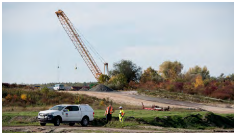
Gelbes RDV-Trägergerät und rotes Bohrgerät für die Sprenglöcher.