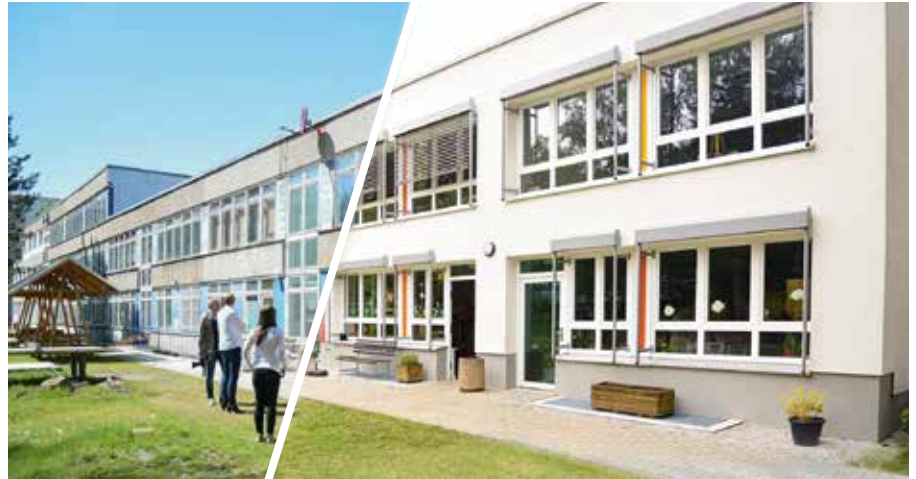
Die Montage zeigt: Aus dem Altbau (linker Bildteil) ist ein schickes, modernes Gebäude (rechts) geworden.

Anlässlich des Kindertages 2022 und in Kooperation mit unserem Freizeitzentrum Borna fand am Mittwoch, dem 1. Juni die offizielle Übergabe unseres frisch sanierten Vereinshauses in der Schulstraße statt.