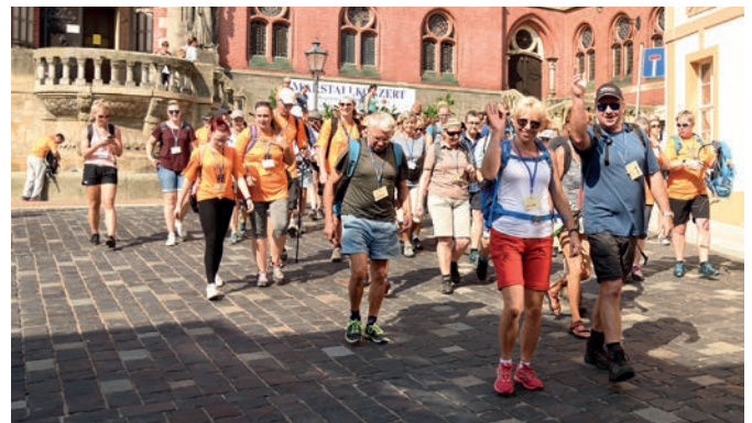
Lutherlauf und Lutherwanderung 2019 (Archiv)

Am 499. Jahrestag des berühmten Aschermittwochbriefes Martin Luthers, dem 5. März 2021, eröffnen die Anmeldeportale für unseren Lutherlauf und unsere Lutherwanderung von Altenburg nach Borna. Die Veranstaltungen sollen planmäßig wie in den vorangegangenen Jahren am letzten Sonntag im August – am 28.08.2021 – stattfinden.