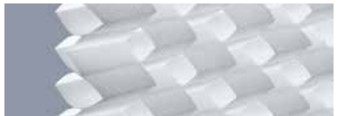
Sogenannte Diamantplissees brechen das Licht an den Fenstern und schaffen eine außergewöhnliche Atmosphäre.