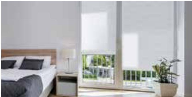
Plissees gehören zu den Klassikern der Fenster-Innendekoration. Auch Maßanfertigungen kann sich heute jeder leisten.

Den Fenstern kommt eine wichtige Rolle bei der Einrichtungsgestaltung zu. Lichtschutz- und innen liegende Sonnenschutzsysteme erfüllen daher nicht nur praktische Funktionen. Sie kleiden das Fenster ein und lassen sich passend zum persönlichen Einrichtungsstil elegant, lässig oder supertrendy gestalten. Echte Schmuckstücke sind zum Beispiel Plissees, die genau nach Maß gefertigt werden und so perfekt in jeden Raum passen.