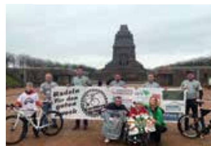
Fotoshooting mit Radio PSR in Leipzig

Katrozan, HGB Haus und Gartenprofi, Fleischerei Meinig, Lars Potkownik Reifen- und Autoservice GmbH, Energiekonzepte Mitteldeutschland GmbH, Allianz Versicherung René Frühauf, Haus-Garten-Hof, Praxen für Ergotherapie Osteroth, Sanitär-Heizung Becker, Wäscherei Volkert GbR, Orthopädietechnik und Sanitätshaus Haas, Augenoptik Seiberlich, Munkelt Bau GmbH, Autohaus Heuter GmbH, Städtische Werke Borna GmbH, EDEKA Kitzscher, Moosi's Veranstaltungsservice) werden bei allen Veranstaltungen auf Bannern, auf den Fahrrädern und den Trikots präsentiert. Außerdem sind die Radrennfahrer im Internet via facebook und instagram aktiv, stellen sich und ihre Arbeit bei verschiedenen regionalen Events vor und möchten zunehmend die Öffentlichkeitsarbeit in der örtlichen Presse ausweiten. Wenn auch Sie unterstützen und Gutes tun möchten, so schauen Sie doch einmal bei facebook vorbei oder schreiben Sie den Piraten eine Mail unter info@tretpiraten.de .