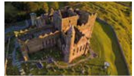
Foto-Film-Reportage von Olaf Schubert Wilde zerklüftete Landschaft, einsame windumtobte Leuchttürme über der Brandung des Meeres, saftig grüne Wiesen mit unzähligen Schafen und Kühen, Karstlandschaften des Burren, die schier lebensfeindlich wirken. Kleine, bunt angelegte Ortschaften und wunderbar gesellige Pubs mit viel irischer Folk-musik, die sich wie ein Flickenteppich im ganzen Land, in den Städten, Dörfern und einsamen Landstrichen verteilen. Offene und charaktervolle Menschen. All das ist Irland. Eines der magischen Länder des Nordens.