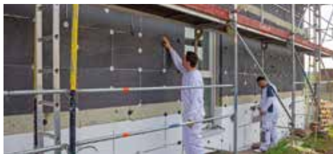
Von einer Fassadendämmung profitiert die Umwelt ebenso wie die Haushaltskasse. Hausbesitzer können so zukünftigen Belastungen durch höhere Energiepreise entgegenwirken.

Um von dem Steuerbonus zu profitieren, muss ein Fachhandwerksbetrieb bestätigen, dass die Arbeiten professionell erfolgt sind. Als Dämmmaterial bietet sich etwa das seit Jahrzehnten bewährte EPS an. Es ist einfach und schnell zu verarbeiten, langlebig und nachhaltig. Unter www.mit-sicherheit-eps.de gibt es mehr Details zu den Fördervoraussetzungen sowie Rechenbeispiele. Weitere wichtige Tipps hat auch die Ratgeberzentrale unter www.rgz24.de/klimapaket-daemmung zusammengefasst. Doch nicht