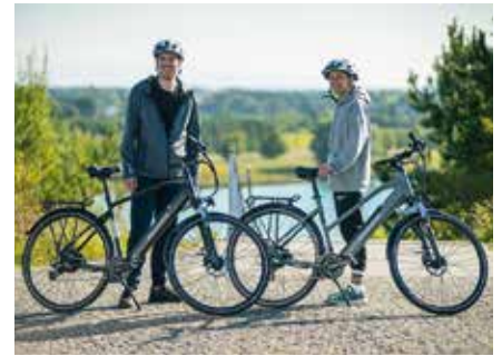
Viele Wege, egal ob beruflich oder privat, lassen sich gut mit E-Bikes bewältigen.

Wichtig ist es, beim Kauf eines Elektrogefährts auf hohe Qualität zu achten. Hier zeichnen unter anderem das CE-Logo oder das Prüfsiegel des Verbands der Elektrotechnik (VDE) sicherheitsgeprüfte Fahrräder aus. Von sogenannten Schnäppchen-Bikes, oftmals Importe aus Fernost mit möglicherweise gefälschten Prüfsiegeln, raten Experten ab – besser sei der Kauf im Fachgeschäft. Die in München ansässige Marke Zündapp beispielsweise liefert über www.pentagonssports.de und weitere Plattformen ausschließlich geprüfte Räder aus Europa, die allen Qualitätsstandards entsprechen. Nach dem Kauf eines qualitativ hochwertigen E-Gefährts kann man selbst noch einiges dafür tun,