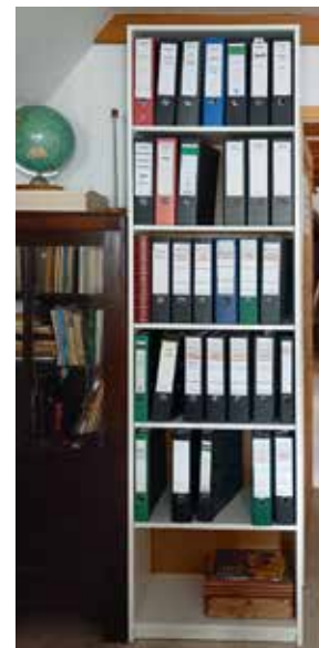
Der Heimatverein bedankt sich bei der Tischlerei Fuhrig aus Panitzsch für die Spende eines dringend benötigten angepassten Ordnerregals.

Text und Fotos: Christine Damm, Heimatverein Borsdorf e. V. www.heimatverein-borsdorf.de info@heimatverein-borsdorf.de