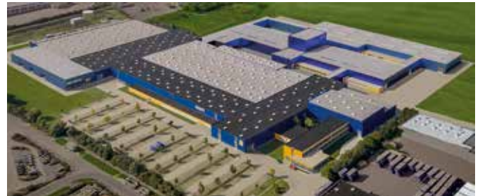
virtueller Blick auf das Firmengelände in Brandis